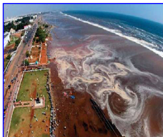
2004年印度洋海啸，30多万人丧生。海啸来临前，很多游客认为当地人的提醒扫了他们游玩的兴致。