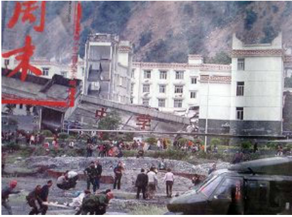
图：倒塌的中学后面是政府 坚固豪华的办公楼

共产党的救灾宣传不是集中在报道灾区的灾情和需要上，而是集中在共产党及其领导、军队在救灾上如何“伟大”，使得外界不能更详细了解灾区的严重灾情，以便更多的提供支援，致使几天过去了许多地方还是没有得到救援，灾民的生命越来越被共产党耽误。