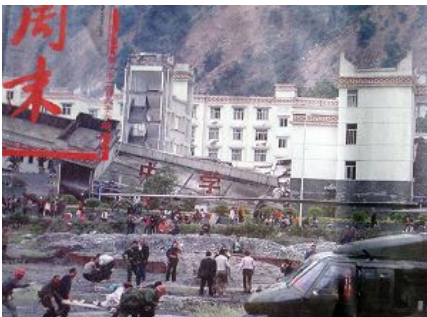
图：倒塌的中学后面是政府 坚固豪华的办公楼

共产党的救灾宣传不是集中在报道灾区的灾情和需要上，而是集中在共产党及其领导、军队在救灾上如何“伟大”，使得外界不能更详细了解灾区的严重灾情，以便更多的提供支援，致使几天过去了许多地方还是没有得到救援，灾民的生命越来越被共产党耽误。