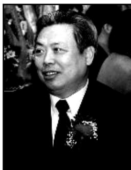
中共纽约总领事 彭克玉