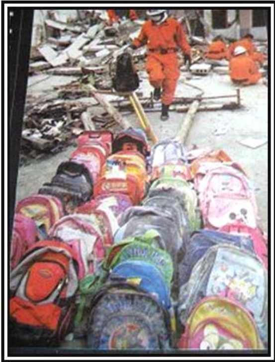
▲ 在学校废墟中收集的小学生书包，待父母认领。

是 1 万亿，（见《炎黄春秋》2008 年第四期）如果削减这些开销的一半就可以建很多坚固优质的教室，挽救千千万万儿童的生命。◇