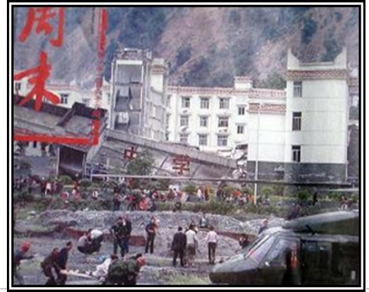
▲老旧灰暗的中学教学楼倒塌了，后面露出光亮气派的办公楼（四川省汶川县）

幅照片我看了几遍，是在汶川县漩口镇拍的，这幅照片中，前面是一所倒塌的老旧灰暗的中学教学楼，一些人在楼前抢救受伤的学生，而在倒塌的教学楼后面却露出了一座光亮，气派的办公楼，不但没有被震倒、震塌，墙上几乎都看不到裂纹。这说明政府办公楼是多么的牢固。