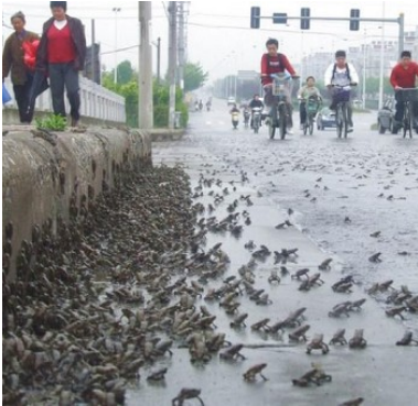
《华西都市报》2008年5月10日报导绵竹市西南镇出现了大规模的蟾蜍迁徙。

在地震前一星期，四川阿坝地区民间已经有即将地震的传言，但是在当地百姓询问地震信息时，却被视为谣言，并且追查所谓“地震谣言”的来源。在2008年5月9日，中共四川省政府的网站上居然公开的进行了所谓的“地震辟谣”，宣称当地没有地震。人民失去了自防自救的机会。结果3天后，大地震就在当地发生了。