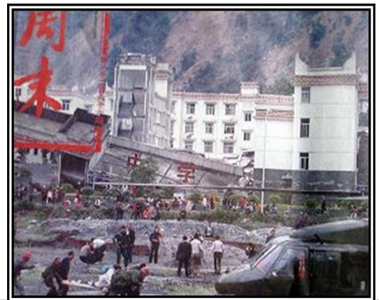
▲老旧灰暗的中学教学楼倒塌了，后面露出光亮气派的办公楼（四川省汶川县）

幅照片我看了几遍，是在汶川县漩口镇拍的，这幅照片中，前面是一所倒塌的老旧灰暗的中学教学楼，一些人在楼前抢救受伤的学生，而在倒塌的教学楼后面却露出了一座光亮，气派的办公楼，不但没有被震倒、震塌，墙上几乎都看不到裂纹。这说明政府办公楼是多么的牢固。