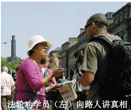
法轮功学员（左）向路人讲真相

二零零八年六月七日周末，苏格兰法轮功学员们在爱丁堡的市中心展开了洪法、讲真相活动。内容包括法轮功功法演示、呼吁制止中共对法轮