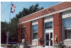
美国伊阿华州市政厅