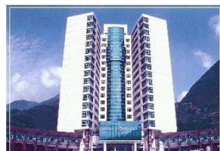
湖北兴山县政府楼