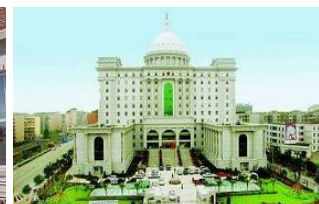
成都武侯区检察院