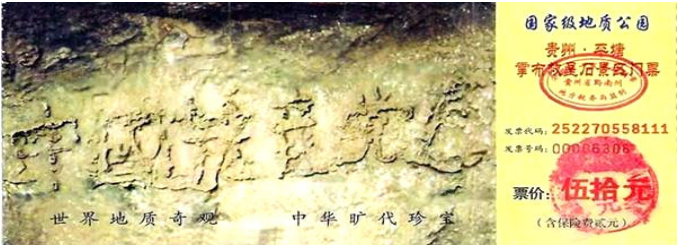
贵州省平塘县掌布乡风景区门票

鉴定，这些字都是天然形成的，没有任何人为加工的痕迹。当时国内一百多家媒体包括新华社、中央台都有过报道与专题，网上也能搜索到相关照片，当然，它们都不敢提最后那个字，但从照片上可以看出来。亿年巨石崩裂，突现标语“中国共产党亡”，这是偶然的吗？