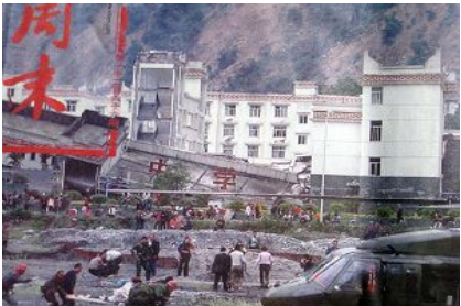
倒塌的中学后面露出了坚固豪华的办公楼

只要向四周看一看就知道是为什么。学校校舍旁边的建筑都没有在地震中倒塌。包括一家宾馆，好几栋居民楼。一些建筑甚至连裂缝都看不到。但是新建小学却完全倒塌。这些学生父母认为，学校校舍之所以倒塌就是因为它的建筑质量差。