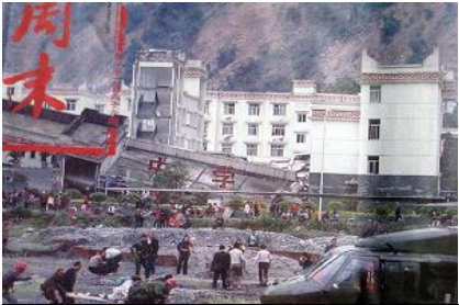
倒塌的中学后面露出了坚固豪华的办公楼

只要向四周看一看就知道是为什么。学校校舍旁边的建筑都没有在地震中倒塌。包括一家宾馆，好几栋居民楼。一些建筑甚至连裂缝都看不到。但是新建小学却完全倒塌。这些学生父母认为，学校校舍之所以倒塌就是因为它的建筑质量差。