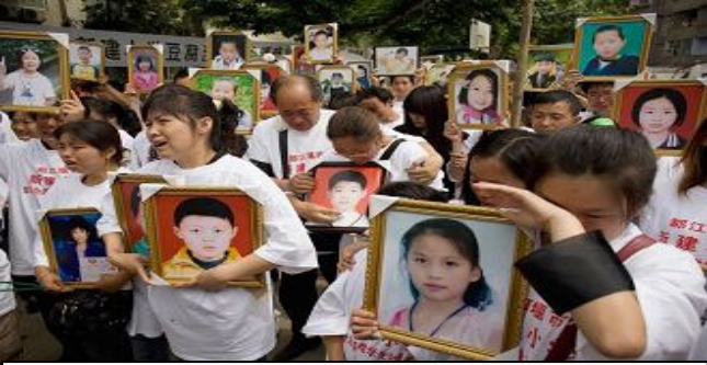
六月一日，四川都江堰 500 余名家长神情悲愤的相聚一起，誓为地震中死难的亲人讨还公道，也为死难的孩子补上最后一个儿童节。

山摇地动大难来， 灾前生死悬一念， 自然面前人力小， 只要三退明真相， 乡亲快把心智开。 劫后枉费空悲哀。 战天斗地白遭灾。 善念一出有未来。◇