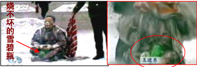
中央电视台“天安门自焚事件”的画面中：