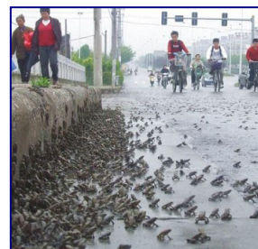
《华西都市报》2008 年 5 月 10 日报导绵竹市西南镇出现了大规模的蟾蜍迁徙。

4 月 26 日上午，有媒体及多家网站报道，紧邻四川的湖北省恩施市白果乡一口天然池塘——观音塘约 8 万立方米