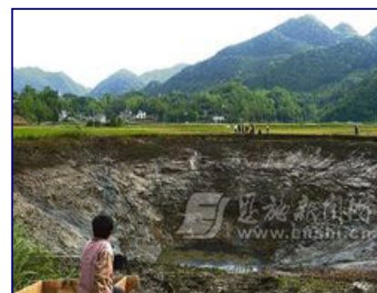
据《恩施晚报》二零零八年五月二日报道，湖北恩施市白果乡的“观音塘”，往日的一池碧水，于四月二十六日上午神秘消失。