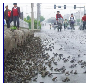
《华西都市报》2008 年 5 月 10 日报导绵竹市西南镇出现了大规模的蟾蜍迁徙。

4 月 26 日上午，有媒体及多家网站报道，紧邻四川的湖北省恩施市白果乡一口天然池塘——观音塘约 8 万立方米