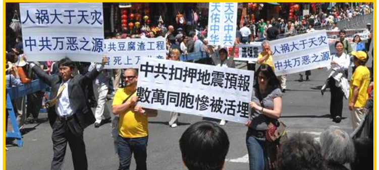
2008年5月25日中午12点，两千余名法轮功学员及社会正义人士在曼哈顿唐人街举行盛大游行，展示法轮大法洪传世界八十几个国家和地区的美好，并以大型标语谴责中共利用四川地震国难，诋毁迫害法轮功。

员的人。中共还宣称法轮功没有捐出一分钱，这是在玩文字游戏。其实法轮功学员作为个人，很多都捐款了，默默无闻，难道非要以“法轮功”作为一个组织来捐款吗？如果真的是“法轮功”作为一个组织来捐款，中共敢收吗？