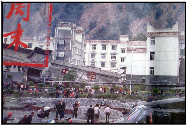
倒塌的中学后面露出坚固豪华的办公楼

小林和学生们刚走到操场上不久，就发生了地震。学校的房屋瞬间垮塌，地裂开约六十多厘米，一个孩子掉了下去，马上被小林拽上地面。操场旁是山，由于地震引起了巨大的山体滑坡，大大小小的石头轰隆隆的从山上滚下来，砸在小林的身上、手上、脸上，将小林的腰砸伤，手、脸被砸青（只是痛，不影响行走）。在这千钧一发的时刻，小林想到了孩子们的安全，她马上向师父求救：“师父，救救我们吧！”这时，神奇的一幕发生了，正在下落的大石头象接到了命令，突然停在了那里。小林马上给在场的学生们讲真相：告诉他们在这危难来时，只有明白大法真相、退队退团才能保命。全班二十三个学生明白真相后，全部退团退队，并用真名写下了声明。由于当时在操场上，没有纸，就把一个烟盒拆开，全班学生郑重地在上写下了自己的名字，留下了珍贵的“三退声明”。