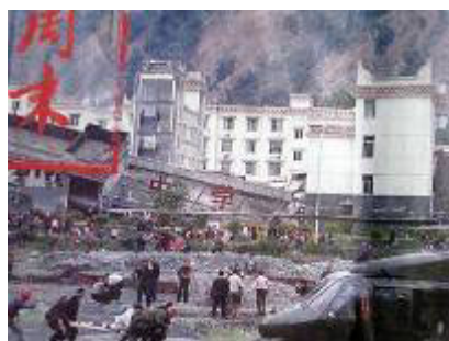
图：倒塌的中学后面是政府坚固豪华的办公楼

大地震中，大部份校舍倒塌，砸死了许多孩子。不管是老校舍还是新校舍，都在地震中倒了。而中共官员很少有死的，中共的办公大楼很少像学校那样倒塌的。十几年前，克拉玛依发生火灾，