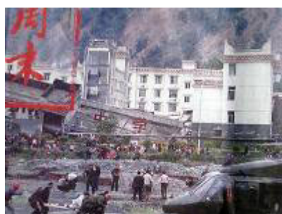
图：倒塌的中学后面是政府坚固豪华的办公楼

大地震中，大部份校舍倒塌，砸死了许多孩子。不管是老校舍还是新校舍，都在地震中倒了。而中共官员很少有死的，中共的办公大楼很少像学校那样倒塌的。十几年前，克拉玛依发生火灾，