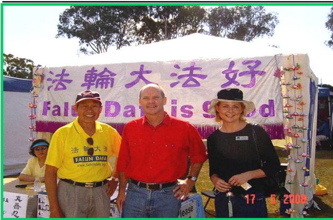
澳洲布里斯本市长坎博尔（右二）鼓励法轮功学员