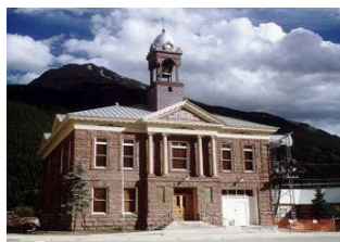
美国科罗拉多州市政厅