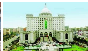
成都武侯区检察院