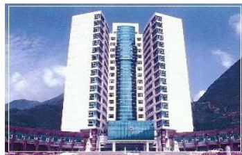
湖北兴山县政府楼