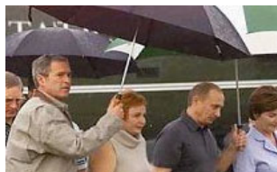
当总统还得给别人打伞，看我们领导下乡多气派！