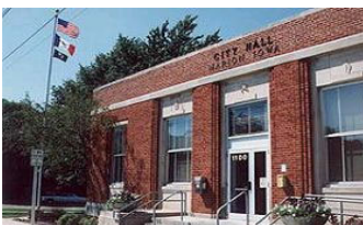
美国伊阿华州市政厅