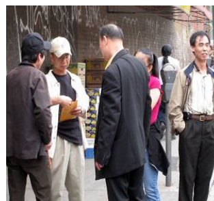
“这是给我的，收起来吧。”