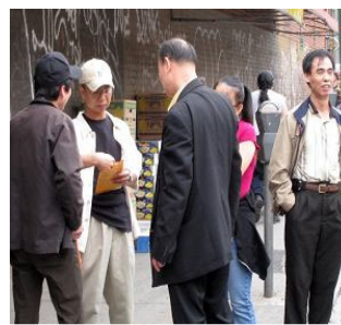
“这是给我的，收起来吧。”