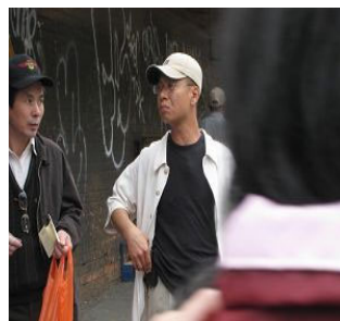
“既然拿了人家的赏，就得继续耍流氓去。”

据法拉盛知情法轮功学员，在骚乱现场有人声称给参与的人员一个人九十美金。从五月二十