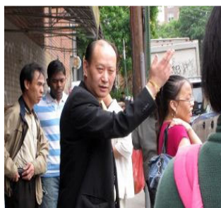
“往那边走。”