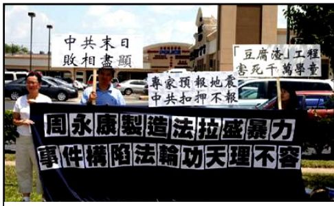
二零零八年五月三十一日，休士頓退党服务中心在中国城举行“声援三千万中国民众退出中共党（团队）组织”集会，强烈谴责纽约总领事幕后操纵攻击法轮功暴力事件。