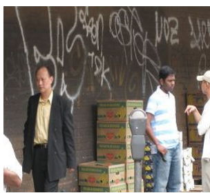
“终于来了，我们都过去吧。”