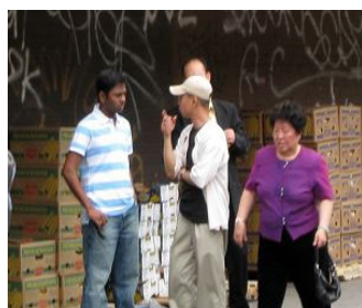
“不要着急，发赏的马上就来。”