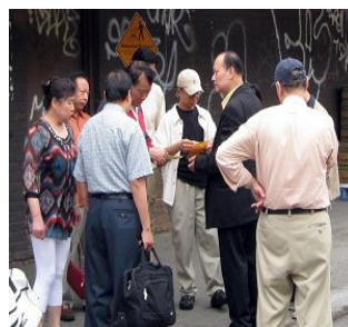
“我得当面点清了。”