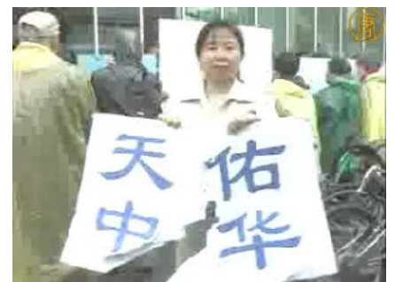
「纽约退党中心」的义工，她手中的「天佑中华」的标语牌被中共收买的暴徒撕毁。

不久前，中共又将法拉盛事件进行断章取义、移花接木的手段进行剪接、包装，制作了一个构陷法轮功的视频，来栽赃法轮功“捣乱”赈灾活动的报导。并在国内的各大网站广泛转载。中共喉舌新华网页转载了该视频，但是很快被紧急删除。外界分析，该视频太假，中共担心像天安门“自焚”一样露馅儿。