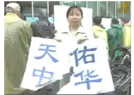
「纽约退党中心」的义工，她手中的「天佑中华」的标语牌被中共收买的暴徒撕毁。

不久前，中共又将法拉盛事件进行断章取义、移花接木的手段进行剪接、包装，制作了一个构陷法轮功的视频，来栽赃法轮功“捣乱”赈灾活动的报导。并在国内的各大网站广泛转载。中共喉舌新华网页转载了该视频，但是很快被紧急删除。外界分析，该视频太假，中共担心像天安门“自焚”一样露馅儿。