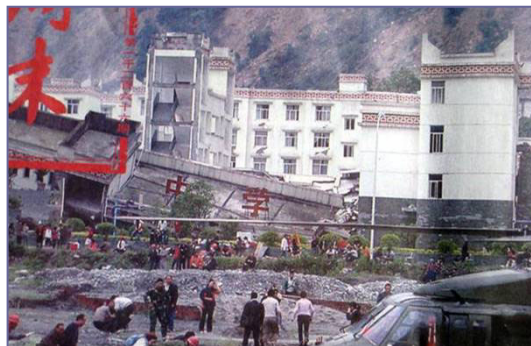
倒塌的中学后面露出坚固豪华的办公楼

⇒ 近半学生死， 校舍多倒塌。 拿起水泥块， 一攥碎哗啦。 偷工又减料， 如同豆腐渣。 政府办公楼， 坚固又豪华。