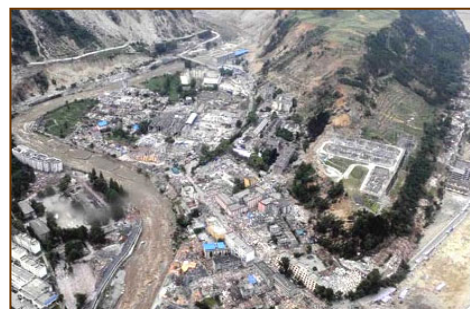
▲ 四川省汶川映秀镇几乎夷为平地