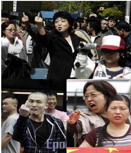
中共特务海外恶行群丑图

很多善良的中国人民真的想象不到，中共竟卑鄙到如此程度，在国难当头的时候，不是集中一切可以集中的有生力量搞救灾，而是立即组织力量疯狂的控制网络、舆论、甚至构陷法拉盛事件，企图进一步陷害法轮功，他们除了大肆宣传如何救灾之外，哪有一点诚心对灾民体恤和怜悯？