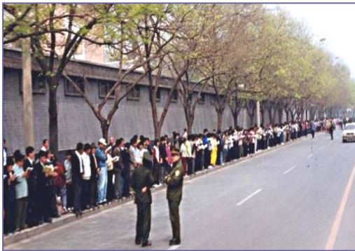
▲四.二五上访现场，法轮功学员文明安静，警察不用维持秩序，在一旁聊天。

出于对政府的信任，法轮功学员四月二十五日自发来到国务院信访办。当日，在国务院总理的直接关注下，合理解决了天津暴力抓人事件。晚上学员们散去时，地上一片纸屑都没有，连警察扔的烟头都给捡起来了。四·二五当晚，江泽民出于妒忌，强行推翻政府总理的开明决定，把和平上访歪曲成