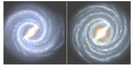
左边是银河系的目前结构 右边是较早的银河系图像

方法，注意到长形盾-半人马座臂膀方向的恒星数量在增加，而人马座和矩尺座臂膀方向的恒星在减少。本杰明在6月4日举行的美国天文学学会大会上发表了其小组的研究结果。