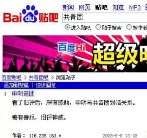
百度贴吧退团声明网络截图

在众多帖子中，有不少网友直接宣布退团。一位网友在“申明退团”的主题中说，看了旧评（编者注：九评）后，深有感触，申明与共青团划清关系。善有善报，旧评神威。（右上图）