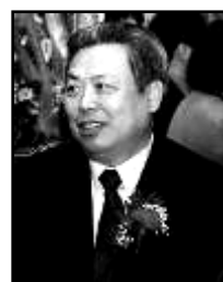
中共纽约总领事 彭克玉

【明慧网】据“追查国际”提供的电话采访录音证实，中共驻纽约总领事 彭克玉 承认中领馆确实参与和策动了最近发生在纽约法拉盛的围攻退党中心义工事件。中共为转嫁严重的政权危机，尤其四川地震后揭示出的中共多次得到地