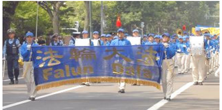
由法轮大法学员组成的“天国乐团”为游行开路

【明慧网】由三十多个国家首脑参加的八国峰会于二零零八年七月七日至九日在日本北海道洞爷湖召开。会议前一日，为声援中国大陆被迫害的法轮功学员，日本法轮功学员来到国际社会聚焦的北海道首府札幌市，举行集会和游行，引起当地和海外主要媒体的关注。