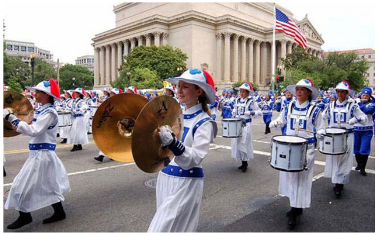
图：7月4日，法轮功天国乐团在美国首都国庆游行中

二零零八年七月四日是美国独立纪念日，也是美国的国庆。游行一直是首都华盛顿国庆庆祝活动的重要组成部分，是以庆祝自由、独立的理念为主题的。法轮功学员连续第七年获邀参加独立日大游行，为这一盛大的庆祝活动增添了独特的东方神韵。