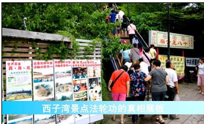
西子湾景点法轮功的真相展板