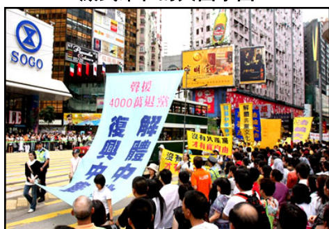
解体中共，复兴中华