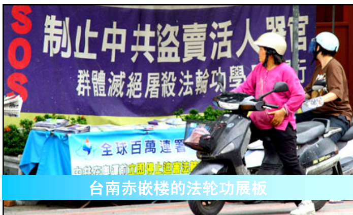
台南赤嵌楼的法轮功展板