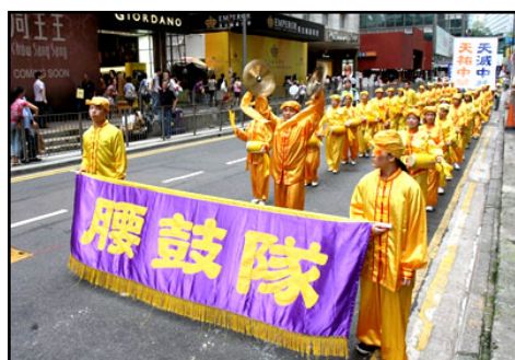
精神振奋的腰鼓队