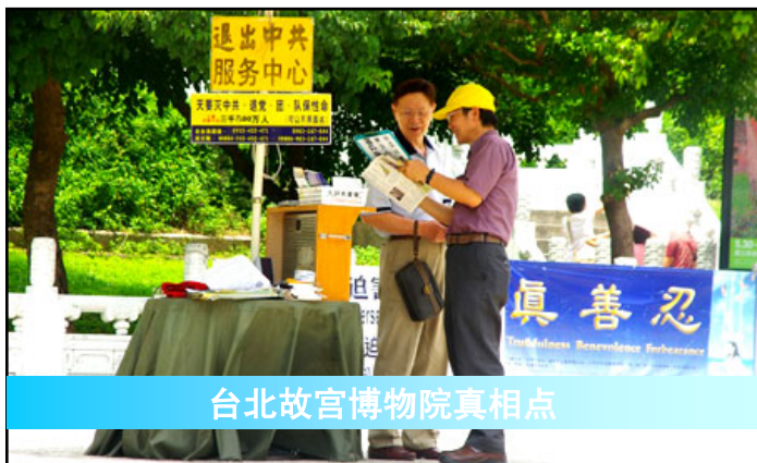
台北故宫博物院真相点