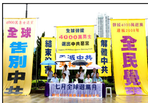
全球声援四千万勇士退出中共

图片新闻：在“三退”（退出中国共产党、退出共青团和退出少先队）浪潮洪壮迈进的“七月全球退党月”里，即将迎来三退人数突破 4 千万的佳音。种种迹象显示，中共恶党正在自身的狂迷暮色中奔向死亡的结局，纵使它在海内外继续歇斯底里的施暴逞凶，也不过是回光返照状态的表现而已。面对中共嗜血的邪恶本质赤裸裸的暴露，全国亿万同胞在走向觉醒，全世界在走向觉醒。中共上下官员都知道恶党必将垮台，大量移居海外“弃船”逃亡；更多的党内志士仁人良知觉醒、深明大义，纷纷向大纪元网站表明三退。“天要灭中共”成为公认的历史必然，“退党保平安”成为觉醒党徒走向未来的必由之路，“解体中共，复兴中华”成为中华民族走向国泰民安的新纪元、复兴神传文化的必然归宿。上下多图为 2008 年七月十二日，香港各界声援 4000 万勇士退出中共大游行的壮观场面。