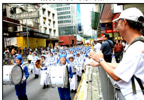
路边观看的市民拍手叫好