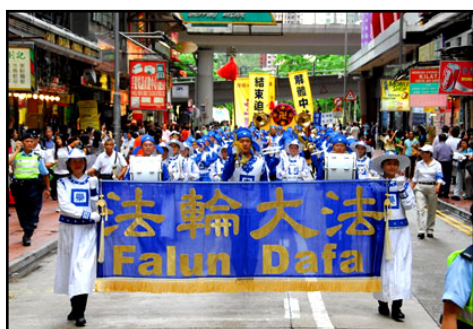
威武雄壮的天国乐团