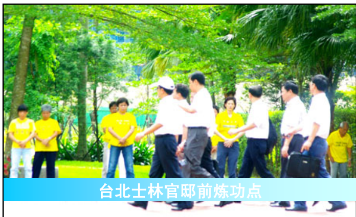
台北士林官邸前炼功点

【明慧网零八年七月十三日】随着大陆游客来台湾观光首发团抵达，法轮功学员在台湾各地景点讲真相活动的情况受到关注。对此，记者实际走访了台南、台北与高雄，与当地景点所在机关、游客与讲真相的法轮功学员进行了访谈，许多受访者表示，这在台湾根本是件寻常事，台湾是民主的社会，享有表达言论自由，台湾民众有权利说出法轮功在大陆受到中共的迫害的事实。也正是台湾可贵之处。