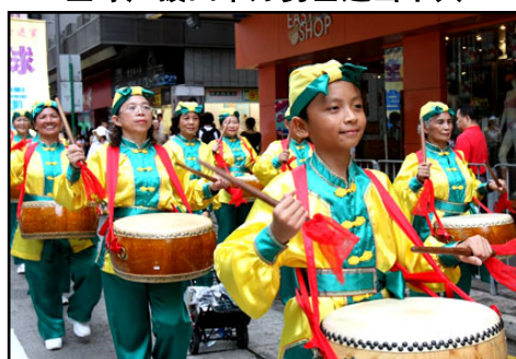
可爱的法轮功小弟子