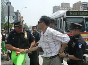
美国警察逮捕谩骂法轮功学员的中共暴徒。

但法拉盛暴力事件已引起国际社会的关注,尤其是中共纽约总领事彭克玉得意忘形,受命中共策动法拉盛围攻活动的录音曝光后,人们通过正与邪、善与恶的鲜明对照,看清了中共的邪恶本质。