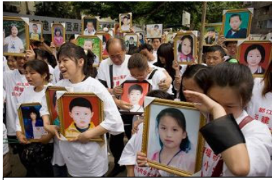
六月一日，四川都江堰500余名家长神情悲愤的相聚一起，誓为地震中死难的亲人讨还公道，也为死难的孩子们补上最后一个儿童节。

【明慧网二零零八年六月二日】星期天（6月1日）儿童节上午，四川都江堰新建小学地震死难学生的数百名父母来到学校废墟，哀悼失去的亲骨肉。新建小学在此次地震中有243名学生遇难。据BBC报导，数百名学生父母站在新建小学的操场上。他们回到自己孩子的学校要讨还公道。这些父母们手里都捧着自己孩子的遗像，每一名死难学生的父母都身穿“为遇难学生讨回公道的”体恤衫。一名母亲对着自己死去的孩子说：“孩子你死得冤啊！”