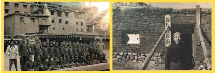
30年代四川的德格县的小学（左）和义敦县县政府（右）

中共难比军阀：上个世纪 30 年代四川省主席刘文辉说“如果县政府的房子比学校好，县长就地正法！”刘文辉就是著名“大地主刘文彩”的弟弟，大军阀。由此却不难看到，70 多年前一个地方军阀是怎么样重视教育的。如果中共官员还有一点刘主席的重教的思想，此次汶川地震，可能会有很多儿童会躲过此劫。