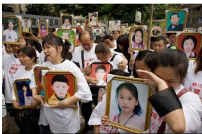
六月一日，四川都江堰500余名家长神情悲愤的相聚一起，誓为地震中死难的亲人讨还公道，也为死难的孩子们补上最后一个儿童节。

【明慧网二零零八年六月二日】星期天（6月1日）儿童节上午，四川都江堰新建小学地震死难学生的数百名父母来到学校废墟，哀悼失去的亲骨肉。新建小学在此次地震中有243名学生遇难。据BBC报导，数百名学生父母站在新建小学的操场上。他们回到自己孩子的学校要讨还公道。这些父母们手里都捧着自己孩子的遗像，每一名死难学生的父母都身穿“为遇难学生讨回公道的”体恤衫。一名母亲对着自己死去的孩子说：“孩子你死得冤啊！”