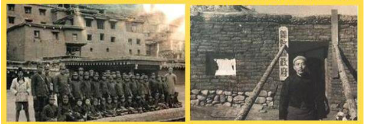
30年代四川的德格县的小学（左）和义敦县县政府（右）

中共难比军阀：上个世纪 30 年代四川省主席刘文辉说“如果县政府的房子比学校好，县长就地正法！”刘文辉就是著名“大地主刘文彩”的弟弟，大军阀。由此却不难看到，70 多年前一个地方军阀是怎么样重视教育的。如果中共官员还有一点刘主席的重教的思想，此次汶川地震，可能会有很多儿童会躲过此劫。