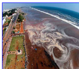
2004 年印度洋海啸，30 多万人丧生。海啸来临前，很多游客认为当地人的提醒扫了他们游玩的兴致。