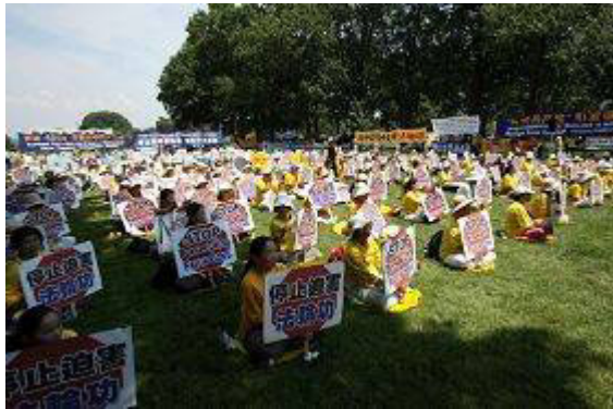
7.20 华盛顿呼吁制止中共迫害的集会现场