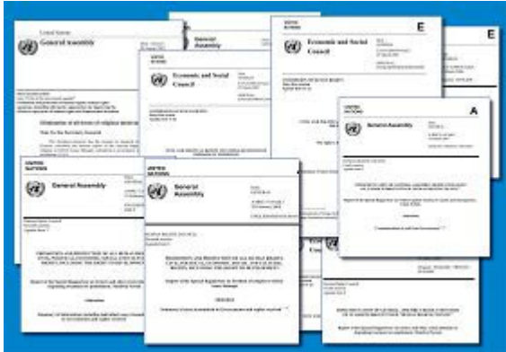
联合国人权大会年度报告

专员认为某些政府人权迫害情况特别严重，他们还会特别批评。也就是说，这些年度报告直接就是对各国政府人权状况的评分。由于联合国人权机制是根据联合国人权理事会的决议所设立，因此他们对人权侵权个案的质询，按照规程各会员国必须予以回复和解释，而他们的回复与解释也记录在年度报告中，成为其政府对人权的态度的直接反映。因此，作为人权状况监督机构，特派专员们的报告举足轻重，而围绕着他们的报告的每一个演讲或活动细节，都可能会成为全球瞩目的焦点。