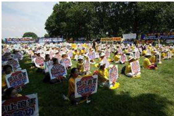
7.20 华盛顿呼吁制止中共迫害的集会现场

听到这个结果，全家人挺着急的。我也去医院看望了妹夫，临走时，我嘱咐他一定多默念“法轮大法好”。第二天早上他就发短信告诉我，当天晚上，他默念了一百多次“法轮大法好”，早上医生又给他做了彩超检查，检查结果是：他的两个肾很健康。几天后，他出院了。出院时，医生又查了尿，还是认为他的尿蛋白有问题，怀疑是慢性肾炎，要求他一个月后再做检查，确定是哪种肾炎然后进行治疗。