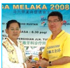
主办方给法轮功学员代表(右)颁奖

“马六甲龙舟金杯锦标赛”六月一日在马来西亚马六甲河畔举行，当地法轮功学员组成的女子和男子队分别获精神奖和纪念奖。主办单位特别安排新加坡法轮功学员组成的腰鼓队前来表演，令龙舟赛更添欢乐气氛。在龙舟赛中，很多民众了解到法轮功真相，人们纷纷签名，呼吁制止中共迫害法轮功。马六甲州首席部长也来了解法轮功，并带走一份真相资料。其他参加龙舟赛的成员也感受到大法的美好，法轮功学员领奖时，他们高喊“法轮大法好”。