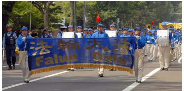
由法轮大法学员组成的“天国乐团”为游行开路

【明慧网】由三十多个国家首脑参加的八国峰会于二零零八年七月七日至九日在日本北海道洞爷湖召开。会议前一日，为声援中国大陆被迫害的法轮功学员，日本法轮功学员来到国际社会聚焦的北海道首府札幌市，举行集会和游行，引起当地和海外主要媒体的关注。