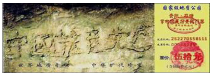
平塘县掌布乡“藏字石”风景区门票

【明慧网】2002年6月，贵州省平塘县掌布乡发现了一块距今2亿7千万年的“藏字石”，500年前崩裂的巨石断面内有六个大字：中国共产党亡。此奇观被100多家报纸、电视、网站报道，只不过报道中没人敢提那个“亡”字，只说前五个字“中国共产党”，但每一个亲眼见到的人都心知肚明。您在网搜索“藏字石”就能查到中国有关“藏字石”的信息。