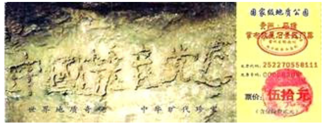
贵州省平塘县掌布乡风景区门票

各路地质专家经实地考察后一致认为，这“藏字石”上未发现任何人工的痕迹，海内外一百多家报纸、电视、网站转发了这消息，“藏字石”的图片还被赫然印在贵州“藏字石”风景区的门票上(下图)。(在网上搜索“藏字石”即可见证！)