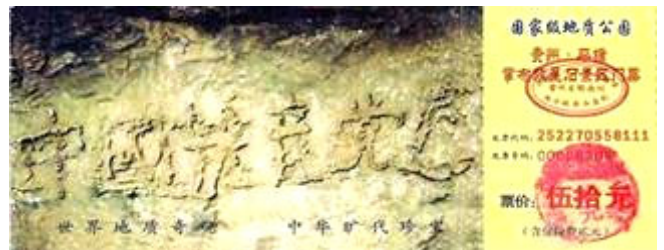
贵州省平塘县掌布乡风景区门票

各路地质专家经实地考察后一致认为，这“藏字石”上未发现任何人工的痕迹，海内外一百多家报纸、电视、网站转发了这消息，“藏字石”的图片还被赫然印在贵州“藏字石”风景区的门票上(下图)。(在网上搜索“藏字石”即可见证！)