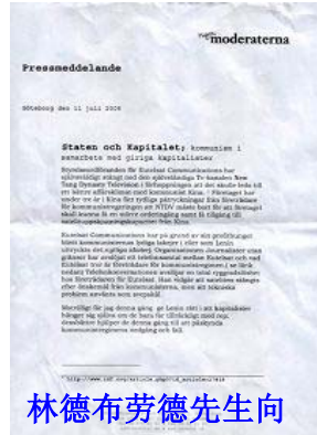
林德布劳德先生向媒体发表的新闻公报

欧卫公司总裁擅自中断了独立电视台——新唐人电视台的卫星播出信号，以此期待与中共建立更密切的关系。该公司在近三年来受到