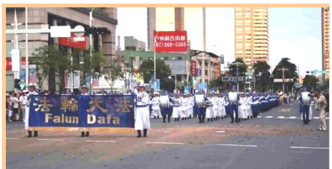
高雄迎世运游行 天国乐团最受欢迎

【明慧网】为迎接零九年世界运动会在高雄举办，台湾高雄市政府于七月十三日下午五时举行「世运倒数一周年大游行」活动。游行地点在高雄市最大最热闹的中山路上，总统马英九、高雄市长陈菊、世界运动总会主席朗佛契等多位贵宾均莅临现场。约六十几个组织和民间团体、近五千民众参与了本次世运倒数一周年的大游行。由二百名法轮功学员组成的天国乐团是阵容最大、气势最好的压轴表演团体。整齐的队伍、嘹亮的乐音，赢得了两旁观众们的惊叹和掌声。◇