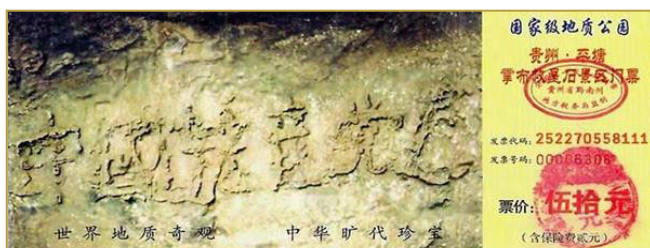
▲图为藏字石风景区门票。

一提到“天灭中共、三退保命”，有人就说是“搞政治”。但如果查查“天灭中共”说法的来源，却发现居然是上天点拨石头“实话石说”。零二年六月，贵州省平塘县掌布乡发现了距今 2 亿 7 千万年的藏字石，自然形成的巨石断面上，惊现“中国共产党亡”六个大字，昭示着“天灭中共”的天象。至 2008 年 7 月 25 日已超过 4057 万中国人顺应天意，声明退出了中共党、团、队组织。