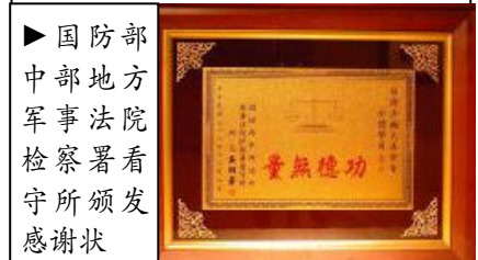
►国防部 中部地方 军事法院 检察署看 守所颁发 感谢状

有些犯人除了自己炼之外，也介绍家人看《转法轮》，不但有助于安定服刑人的情绪，也使监