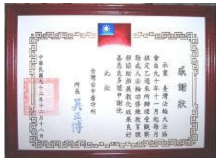
▲台中看守所颁发感谢状

“对这些人，平常我每天要做的事情就是写惩处单。上了法轮功的九天班后，奇迹就在第六天发生，后四天我都没开惩处单，冲突竟然没有了。”