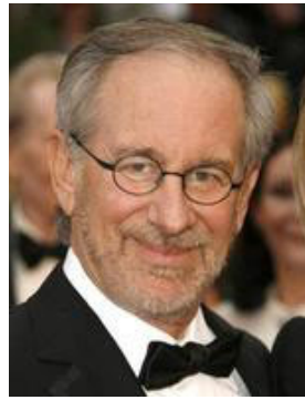
斯蒂芬·斯皮尔伯格

奥斯卡金像奖影片《辛德勒名单》是美国著名导演斯蒂芬·斯皮尔伯格于1993年拍摄的一部轰动世界的宏篇巨制。影片深刻地揭露了德国法西斯屠杀犹太人的恐怖罪行，并以其极高的艺术性成为94年全球最为瞩目的一部影片