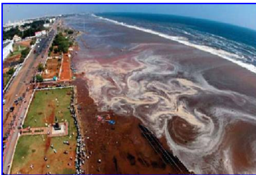
2004年印度洋海啸，30多万人丧生。海啸来临前，很多游客认为当地人的提醒扫了他们游玩的兴致。

纵观历史，曾经不可一世的古罗马帝国，因残酷迫害基督徒而遭到四次大瘟疫的惨烈天谴：四处满是腹部肿胀、嘴里喷出脓水、眼睛通红的尸体，重重叠叠，无人埋葬，在街上、庭院、教堂里腐烂开裂着……。见证了瘟疫惨景的史学家约翰写下了他的忠言：“用我们的笔，让后人知道上帝惩罚我们的数不胜数的事件中的一小部份，这总非坏事，希望后人会对我们因所造罪业而遭受的可怕灾祸感