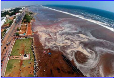
2004年印度洋海啸，30多万人丧生。海啸来临前，很多游客认为当地人的提醒扫了他们游玩的兴致。

纵观历史，曾经不可一世的古罗马帝国，因残酷迫害基督徒而遭到四次大瘟疫的惨烈天谴：四处满是腹部肿胀、嘴里喷出脓水、眼睛通红的尸体，重重叠叠，无人埋葬，在街上、庭院、教堂里腐烂开裂着……。见证了瘟疫惨景的史学家约翰写下了他的忠言：“用我们的笔，让后人知道上帝惩罚我们的数不胜数的事件中的一小部份，这总非坏事，希望后人会对我们因所造罪业而遭受的可怕灾祸感