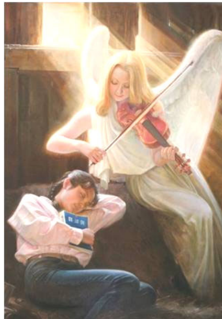
真善忍美展作品: 流离失所