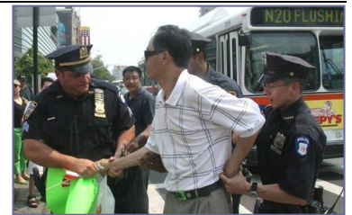
纽约警方逮捕漫骂法轮功学员的中共暴徒

但是在民主法制社会里，中共的谎言和暴力没有市场。“法拉盛暴力事件”已日益引起美国和全世界的广泛关注，上百名联邦议员、国务院、联邦调查局、国土安