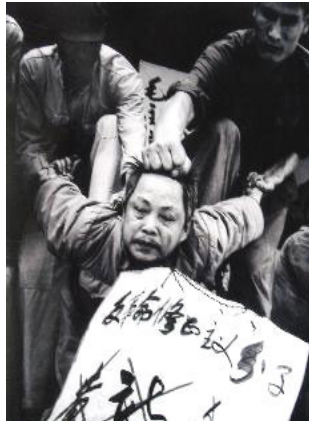
“文革”中典型批斗场面