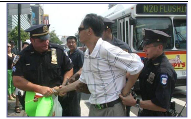
纽约警方逮捕漫骂法轮功学员的中共暴徒

但是在民主法制社会里，中共的谎言和暴力没有市场。“法拉盛暴力事件”已日益引起美国和全世界的广泛关注，上百名联邦议员、国务院、联邦调查局、国土安