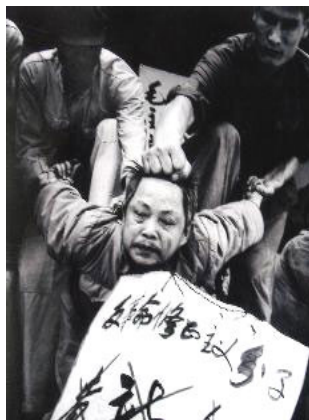
“文革”中典型批斗场面

但是在民主法制社会里，中共的谎言和暴力没有市场。“法拉盛暴力事件”已日益引起美国和全世界的广泛关注，上百名联邦议员、国务院、联邦调查局、国土安