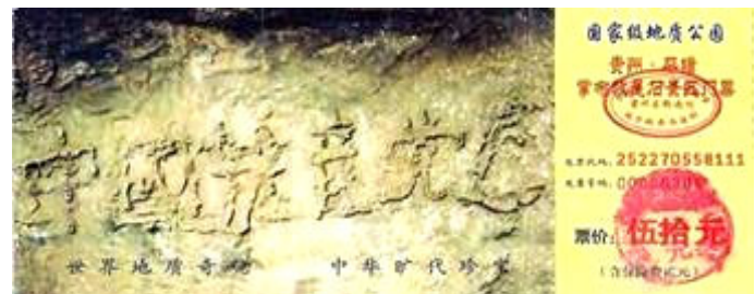
贵州省平塘县掌布乡风景区门票