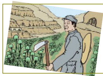
南泥湾“大生产运动”，实际上是非法种鸦片的运动。

当今中共为了迫害法轮功，同样用卑鄙的手段造了很多谣言。随着“天安门自焚”等假案陆续被揭穿，以及《九评共产党》的问世，人们越来越看清了中共的邪恶，觉醒的百姓纷纷顺应天意，退出党、团、队，保平安。在此善劝父老乡亲们：赶快了解真相。特别是那些为眼前名利跟着邪党迫害善良的人，当天灭中共、大难来临时，