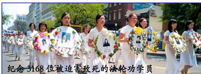
纪念 3168 位被迫害致死的法轮功学员