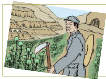
南泥湾“大生产运动”，实际上是非法种鸦片的运动。

当今中共为了迫害法轮功，同样用卑鄙的手段造了很多谣言。随着“天安门自焚”等假案陆续被揭穿，以及《九评共产党》的问世，人们越来越看清了中共的邪恶，觉醒的百姓纷纷顺应天意，退出党、团、队，保平安。在此善劝父老乡亲们：赶快了解真相。特别是那些为眼前名利跟着邪党迫害善良的人，当天灭中共、大难来临时，