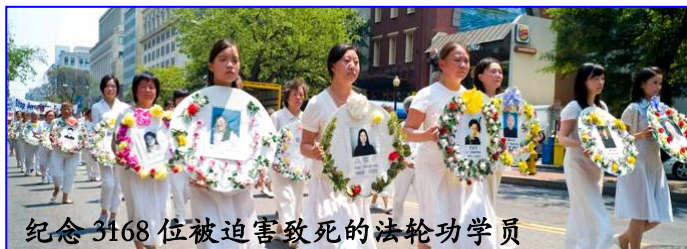
纪念 3168 位被迫害致死的法轮功学员