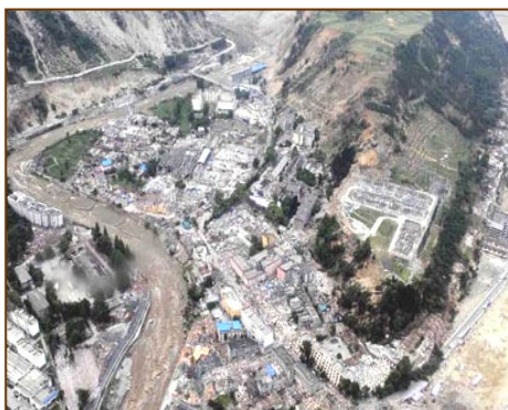
▲ 四川省汶川映秀镇几乎夷为平地

从震后的废墟中，人们都看到了一个事实，这些倒塌的校舍，大多是豆腐渣工程所导致的。所谓豆腐渣工程，就是以劣质材料或偷工减料建成的。楼虽然盖起来了，在它们还没倒塌之前，表面上与正料建盖的大楼没什么两样。但是，灾难来时，