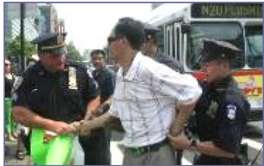
纽约警方逮捕谩骂法轮功学员的中共暴徒

法拉盛事件已经得到美国上百名联邦参议员、众议员办公室，国务院、联邦调查局、国土安全部等的关注和调查，十多位政要谴责文革式的黑色暴力，并表示这样的攻击损害了美国的立国精神：自由和人权。（左