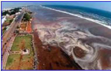
2004年印度洋海啸，30多万人丧生。海啸来临前，很多游客认为当地人的提醒扫了他们游玩的兴致。