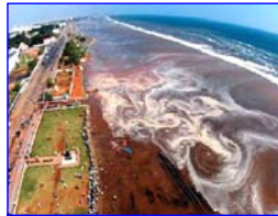
2004 年印度洋海啸，30 多万人丧生。海啸来临前，很多游客认为当地人的提醒扫了他们游玩的兴致。

老太太一看石狮子的眼睛红了，焦急的向乡亲们大喊：“快跑啊！要发大水了！”村里的人觉的她傻，嘲笑她，没有一个人听她的。老太太只好一个人往山上跑。