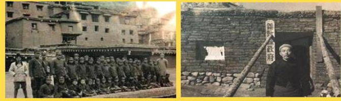
30年代四川的德格县的小学（左）和义敦县县政府（右）

州《南方工报》一篇“三分钟通话 悲喜两重天”的新闻报导显示，汶川某学校在地震前一小时，接到紧急通知，于是老师带着学生紧急撤离而避免了伤亡。