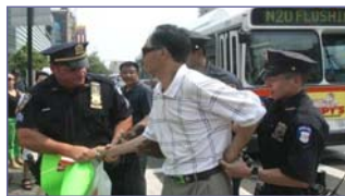
纽约警方逮捕谩骂法轮功学员的中共暴徒

但是在民主法制社会里，中共的谎言和暴力没有市场。“法拉盛暴力事件”已日益引起美国 and 全世界的广泛关注，上百名联邦议员、国务院、联邦调查局、国土安全部，都在关注、调查此事，十多位政要谴责中共的文革式暴力。人们更通过法轮功学员在逆境中慈悲、祥和的表现，看到了正与邪、善与恶的鲜明对照，看清了中共对中国人民、对国际社会的巨大危害。