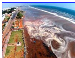
2004 年印度洋海啸，30 多万人丧生。海啸来临前，很多游客认为当地人的提醒扫了他们游玩的兴致。

老太太一看石狮子的眼睛红了，焦急的向乡亲们大喊：“快跑啊！要发大水了！”村里的人觉的她傻，嘲笑她，没有一个人听她的。老太太只好一个人往山上跑。