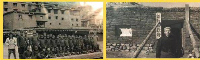
30年代四川的德格县的小学（左）和义敦县县政府（右）

是谁视生命为草芥，是谁在不惜一切代价的救人？亲爱的同胞请您擦亮双眼。希望我们每一个人都能不再被欺骗，都能提前了解真相，都能明辨是非善恶，都能永保平安。