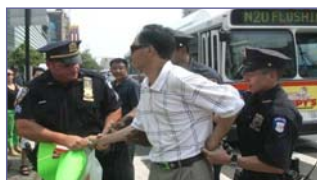
纽约警方逮捕谩骂法轮功学员的中共暴徒

但是在民主法制社会里，中共的谎言和暴力没有市场。“法拉盛暴力事件”已日益引起美国 and 全世界的广泛关注，上百名联邦议员、国务院、联邦调查局、国土安全部，都在关注、调查此事，十多位政要谴责中共的文革式暴力。人们更通过法轮功学员在逆境中慈悲、祥和的表现，看到了正与邪、善与恶的鲜明对照，看清了中共对中国人民、对国际社会的巨大危害。