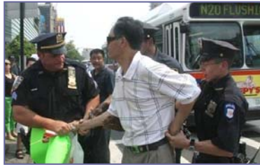
纽约警方逮捕谩骂法轮功学员的中共暴徒

但是在民主法制社会里，中共的谎言和暴力没有市场。“法拉盛暴力事件”已日益引起美国和全世界的广泛关注，上百名联邦议员、国务院、