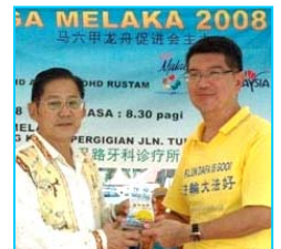
主办方给法轮功学员代表（右）颁奖