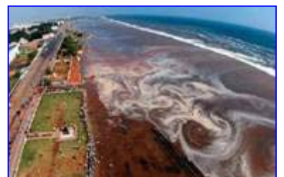
2004年印度洋海啸，30多万人丧生。海啸来临前，很多游客认为当地人的提醒扫了他们游玩的兴致。

村口有个老太太正在给佛上香，老太太说：“就这一碗饭了，给你半碗吧，留下半碗还得给佛上供呢。”地藏菩萨一看老太太心地善良，临行时就指着村口的一对儿狮子对她说：“什么时候这对儿狮子的眼睛红了，就是要发大水了，你就赶快往山上跑，保你平安。”善良的老太太马上把这消息告诉了乡亲，结果全村的人没有一个相信她的，还讥笑她，讽刺她。老太太不顾冷嘲热讽，坚持把逃生的