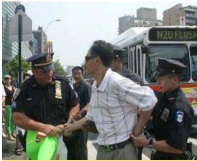
美国警察逮捕谩骂法轮功学员的中共暴徒。

中共收买的暴徒拒绝警察让他收起谩骂法轮功的标语走人的要求，而被警察收走标语，又因拒绝出示证件，被警察戴上手铐逮捕。法拉盛暴力事件以来，已有多名攻击谩骂法轮功学员的暴力分子被警察抓捕，也有的以“行为不当”被罚款。◇