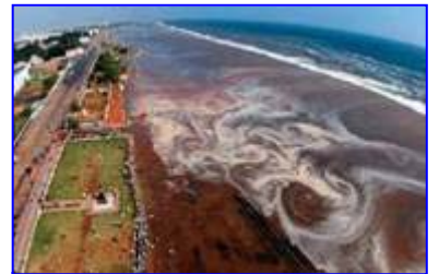
2004年印度洋海啸，30多万人丧生。海啸来临前，很多游客认为当地人的提醒扫了他们游玩的兴致。

村口有个老太太正在给佛上香，老太太说：“就这一碗饭了，给你半碗吧，留下半碗还得给佛上供呢。”地藏菩萨一看老太太心地善良，临行时就指着村口的一对儿狮子对她说：“什么时候这对儿狮子的眼睛红了，就是要发大水了，你就赶快往山上跑，保你平安。”善良的老太太马上把这消息告诉了乡亲，结果全村的人没有一个相信她的，还讥笑她，讽刺她。老太太不顾冷嘲热讽，坚持把逃生的