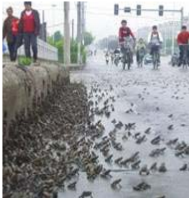
《华西都市报》2008年5月10日报导绵竹市西南镇出现了大规模的蟾蜍迁徙。

这次汶川大地震，并不是没有专业和非专业人员的预报，但是被共产党为了保证“奥运”的所谓“稳定”、“和谐”气氛而给压制、隐瞒了起来。2年前就有专