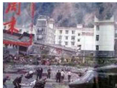
倒塌的中学后面是政府坚固豪华的办公楼 (汶川县)

大地震中, 大部份校舍倒塌, 砸死了许多孩子。不管是老校舍还是新校舍, 都在地震中倒了。而中共的办公大楼很少像学校那样倒塌的。十几年前, 克拉玛依发生火灾, “让领导先走”的命令使得几