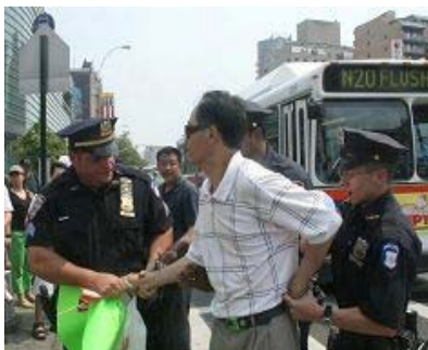
美国警察逮捕谩骂法轮功学员的中共暴徒。

中共收买的暴徒拒绝警察让他收起谩骂法轮功的标语走人的要求，而被警察收走标语，又因拒绝出示证件，被警察戴上手铐逮捕。法拉盛暴力事件以来，已有多名攻击谩骂法轮功学员的暴力分子被警察抓捕，也有的以“行为不当”被罚款。◇