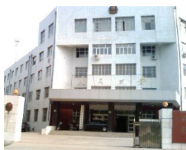
富拉尔基公安分局