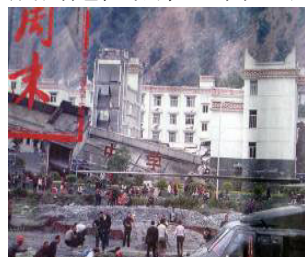
▲中学教学楼倒塌了，后面露出光亮气派的办公楼（四川汶川县）