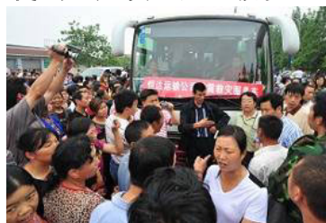
▲在地震中失去孩子的家长集体抗议，要求调查豆腐渣工程。

太多证据表明：此次大地震早已有多方专家准确预测且通报中共高层。如：中国的地震科学家耿庆国预报了阿坝地区将发生 7 级以上地震，他明确提出“阿坝地区 7 级以上地震的危险点在 5 月 8 日