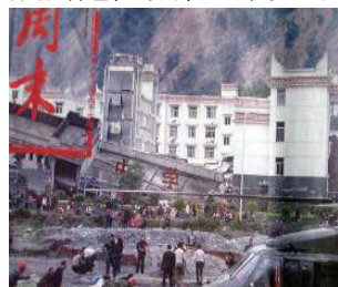
▲中学教学楼倒塌了，后面露出光亮气派的办公楼（四川汶川县）