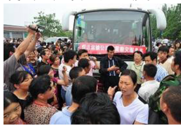
▲在地震中失去孩子的家长集体抗议，要求调查豆腐渣工程。

太多证据表明：此次大地震早已有多方专家准确预测且通报中共高层。如：中国的地震科学家耿庆国预报了阿坝地区将发生 7 级以上地震，他明确提出“阿坝地区 7 级以上地震的危险点在 5 月 8 日